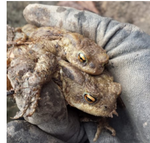
Umsetzen von Erdkröten