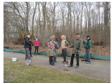
Bau von Amphibien-Zäunen auf dem Lindenberg in Neubrandenburg