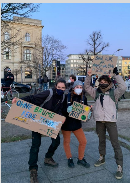
Aktivistinnen der For Future Gruppe vor dem Verkehrsministerium in Berlin

Aktivistinnen der For Future Gruppe der Hochschule Neubrandenburg waren mit dabei, um die Verkehrs- und Klimawende zu unterstützen. Gemeinsam fordern wir die gerechte